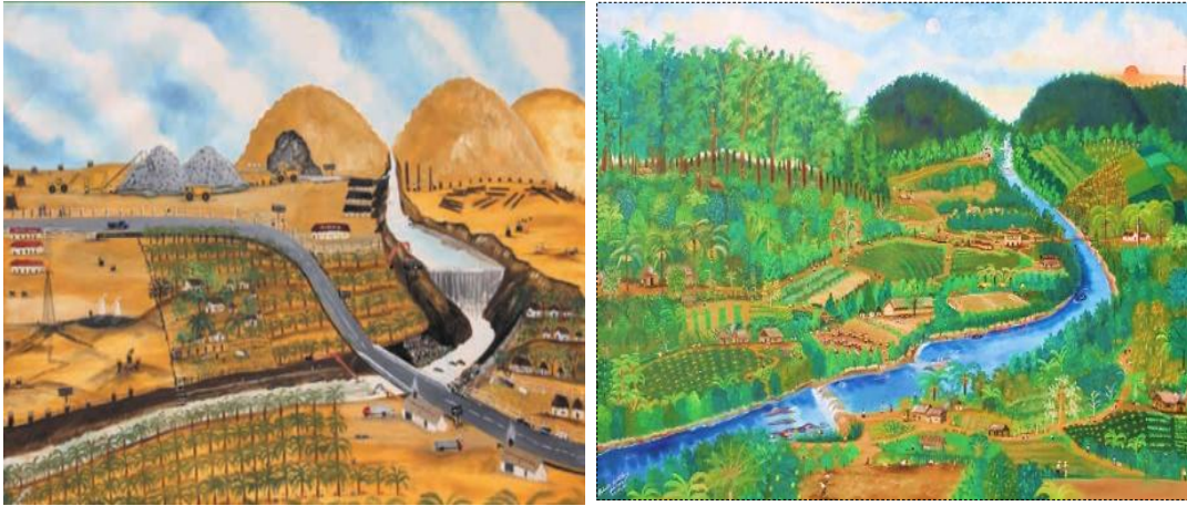
Ilustración 1. Dibujo amarillo y verde de SANK

En la Costa Pacífica del Cauca, la Fundación Chiyangua ejerce la coordinación y secretaría técnica de la red Matamba y Guasá que articula a 32 organizaciones de mujeres de tres municipios de la costa pacífica caucana. Junto con la Fundación Chiyangua que coordina acciones en el municipio de Guapi, la organización "Apoyo a Mujer" coordina el trabajo en el municipio de Timbiquí, mientras que "Asomo África" lo hace en el municipio de López. Bajo el lema "Mujer, cultura y territorio", las organizaciones de la Red Matamba y Guasá con el apoyo de la Fundación ACUA, luchan por la "dignificación de la mujer negra" y la promoción de sus derechos, así como por la valorización de productos y recetas tradicionales y el reconocimiento del rol fundamental de las mujeres en los hogares, comunidades y territorios. El punto de entrada de la transición agroecológica en la costa Pacífica del Cauca se relaciona al principio de valores sociales y dietas.