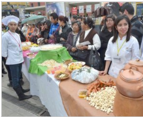
VARIAS INSTITUCIONES ABRIERON IMPORTANTE ESPACIO PARA DIFUNDIR LA CULINARIA NACIONAL. GALERÍA(4)