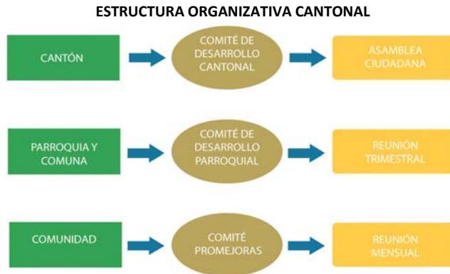
Fuente: "Del Clientelismo político a la participación ciudadana, segunda edición, 2009" 13