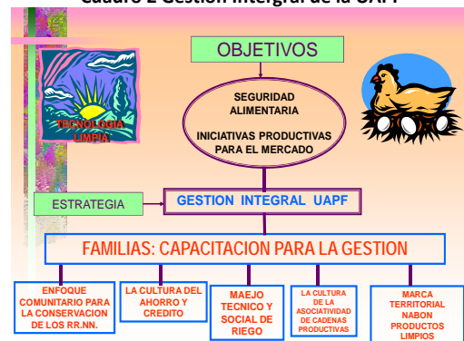
Cuadro 2 Gestión Integral de la UAPF