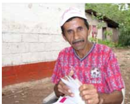
Lider de la comunidad de San Diego, Condega.