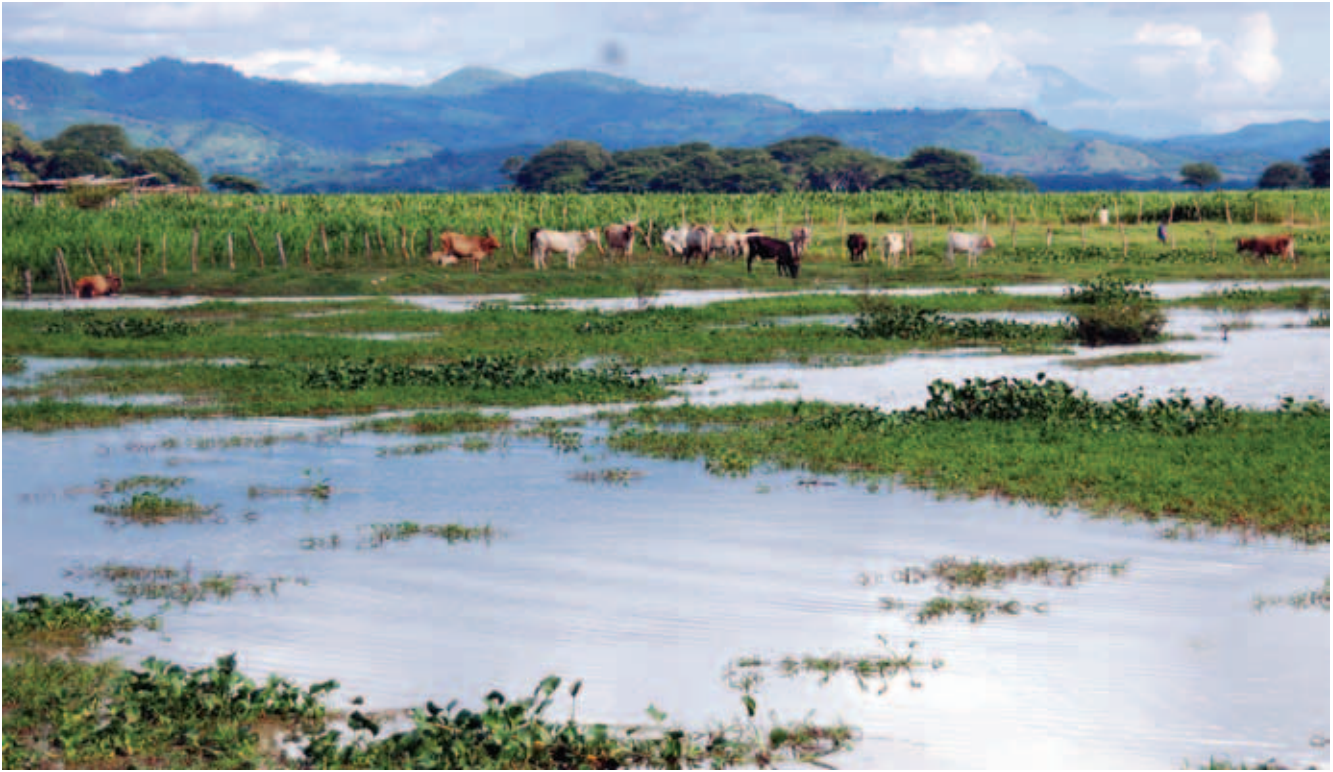
Chalatenango, El Salvador