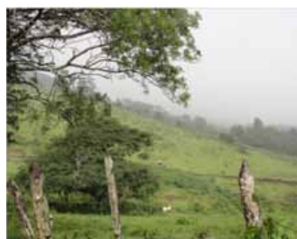
Sector del Cerro Las Brisas, Estelí, (en verano es afectado por incendios forestales)