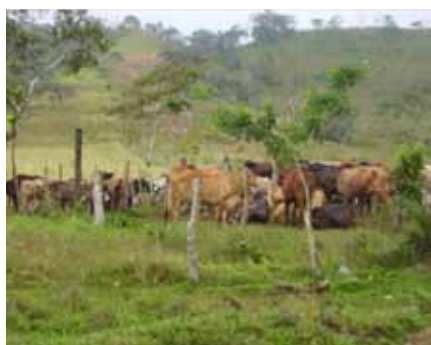
La ganadería, principal actividad económica en la zona de Santo Tomás