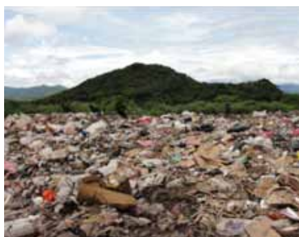
Relleno sanitario en que afecta los ríos y a la población en la comunidad de San Diego, Condega.