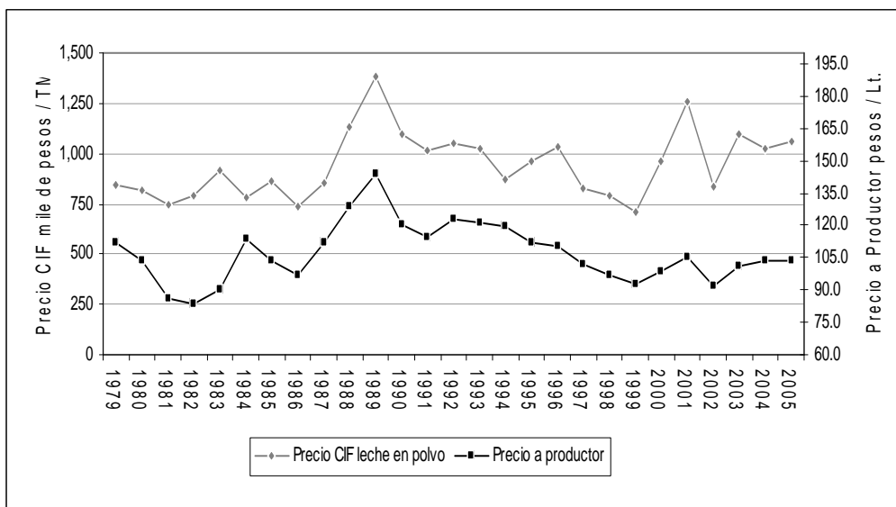
Figura 1. Evolución de los precios CIF de leche en polvo y pagados a productor.