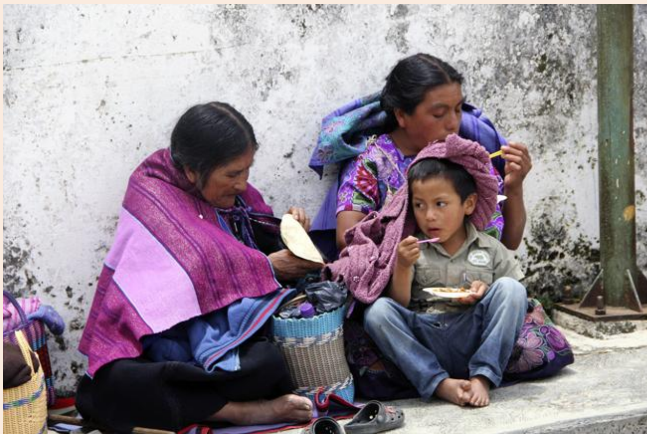
Las mujeres presentan mayor desigualdad para generar ingresos de manera autónoma.

América Latina exhibe el título de ser la región más inequitativa del mundo, incluso sobre regiones que presentan mayores niveles de pobreza. La desigualdad es un tema clave del retroceso latinoamericano, cruza el debate público, académico y está cada vez más presente en la agenda de