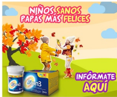
Publicidad por Bligoo.com