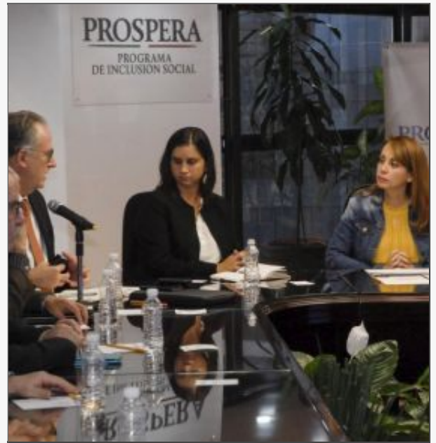
Familias PROSPERA participan en el Programa Piloto Territorio Productivos.