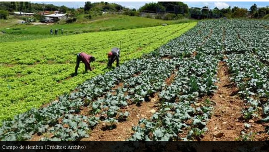
Campo de siembra

Los resultados de este encuentro se convertirán en políticas públicas que contribuyan a fortalecer el desarrollo rural y la sustentabilidad