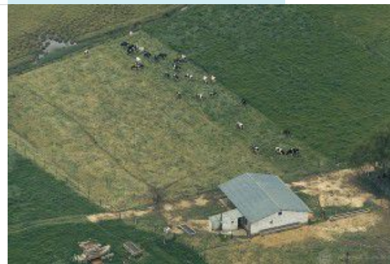
Vista aérea de paisaje rural, Colombia

El Seminario, en su tercera versión, contó con la asistencia de representantes de los diferentes subsectores del orden nacional y/o territorial, lo cual favoreció la creación de un diálogo constructivo, a través del cual se aportaron experiencias en materia de desarrollo rural con enfoque territorial y se discutieron perspectivas de diseño e implementación. " La estrategia de desarrollo rural para Colombia debe pasar de una visión sectorial a una multisectorial, en la que se contemplen todos los sectores productivos y de servicios presentes en las zonas rurales, las condiciones ambientales del territorio, la dotación de activos productivos y de infraestructura, la prestación de servicios públicos y sociales, el fortalecimiento del desarrollo humano y la construcción de tejido y capital social " agregó Perry.