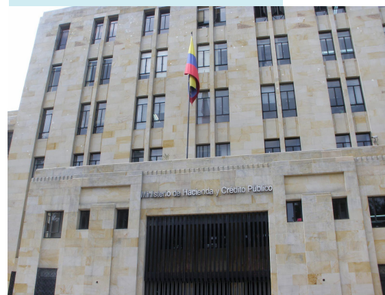
Ministerio de Hacienda de Colombia