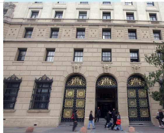
Ministerio de Hacienda de Chile

El primer abordaje de la pobreza es un tema valórico. Mientras más tiempo demoremos en comprender esto, las desigualdades se mantendrán e, incluso, aumentarán.