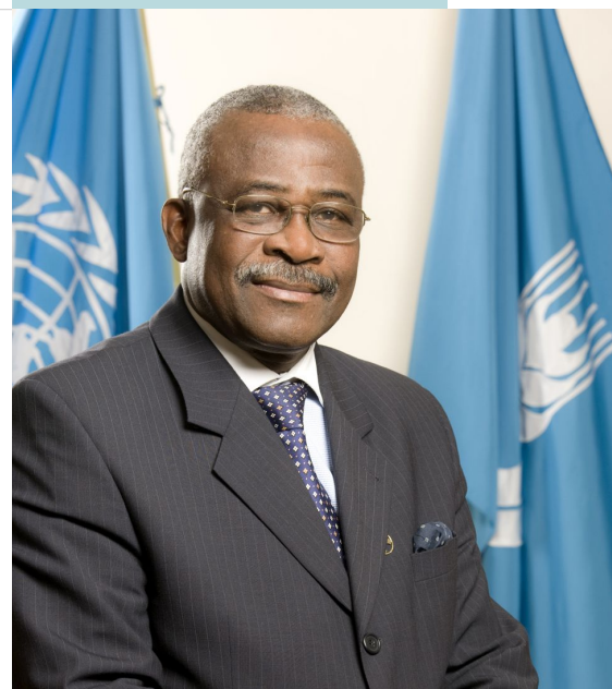
Dr. Kanayo Nwanze

rural y la institucionalidad asociada con ello. Esto último, a partir de innovaciones que han permitido una mejor focalización y eficiencia del gasto público, así como un escalamiento de experiencias que han comenzado como pequeños proyectos piloto y poco a poco van consolidándose y tomando escala.