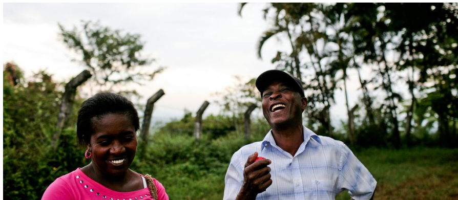
Agricultores de la villa de San Nicolás, Valle del Cauca, Colombia