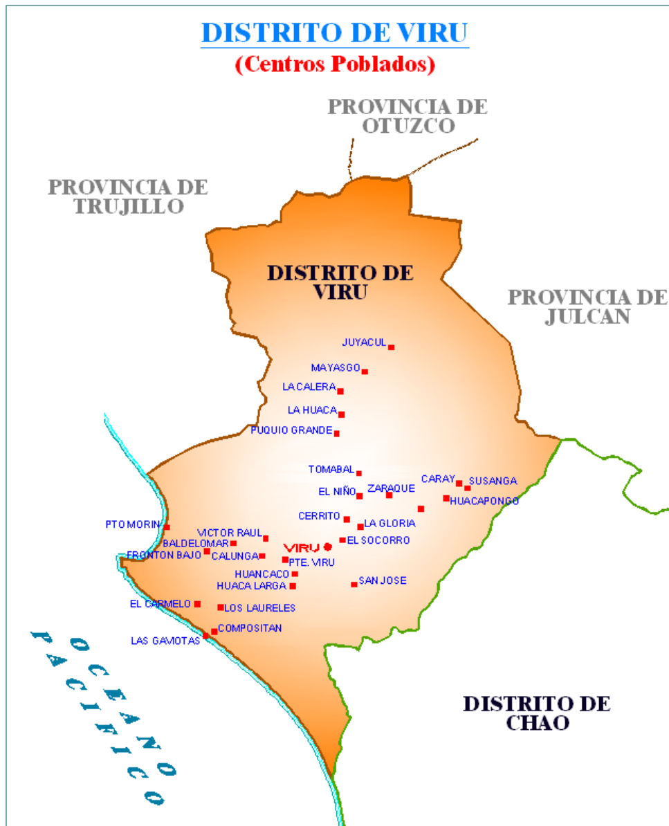
Imagen 4: Distrito Virú y sus principales pueblos