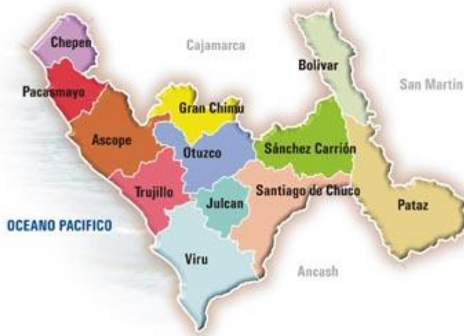
Imagen 1: Departamento La Libertad y sus provincias