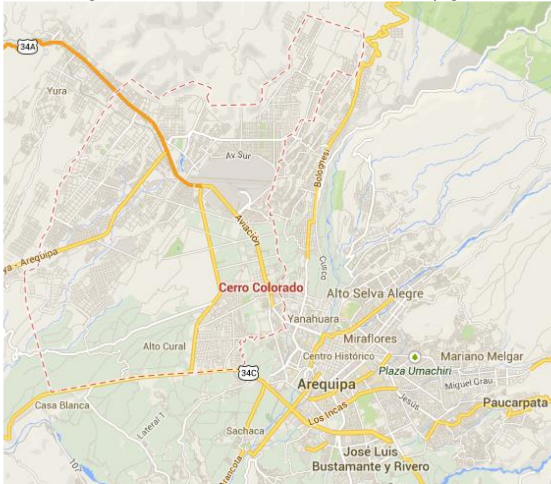
Imagen 8: Distrito de Cerro Colorado, sus zonas urbanas y agrícolas