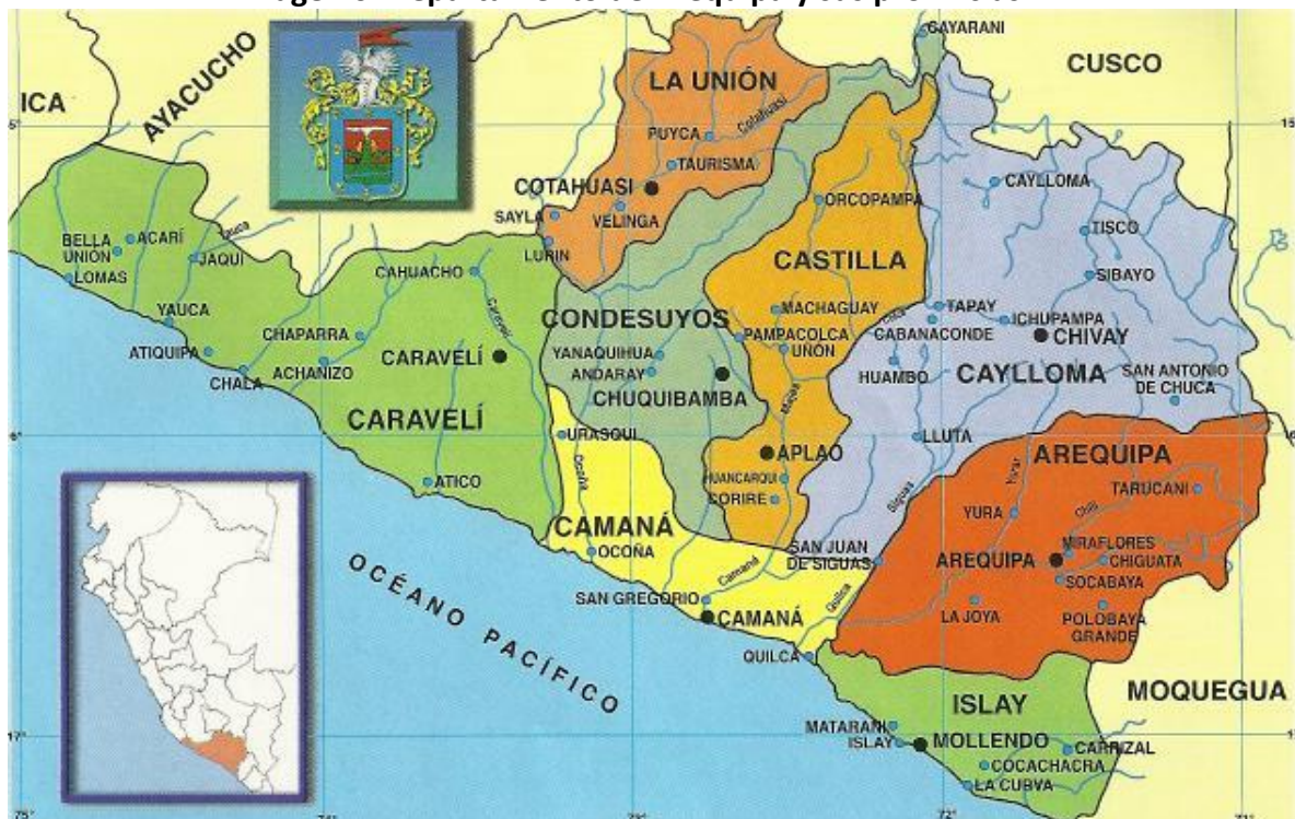
Imagen 6: Departamento de Arequipa y sus provincias