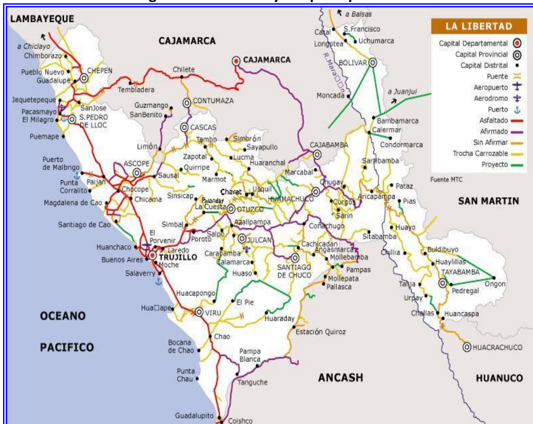
Imagen 2: La Libertad y sus principales referencias