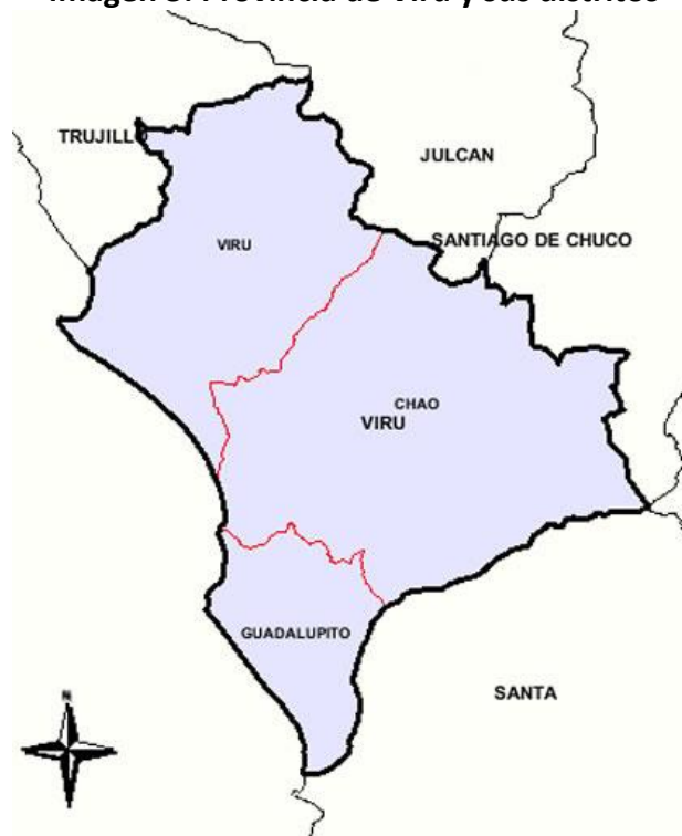
Imagen 3: Provincia de Virú y sus distritos